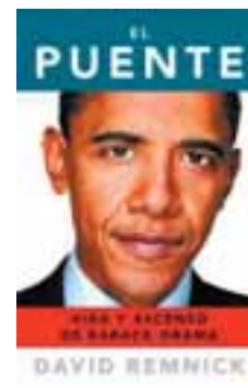
EL PUENTE Autor: David Remnick Editorial: Debate, 2010 Páginas: 752 Precio: 26,90 euros