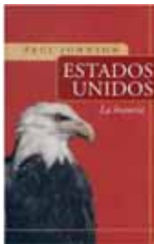
EEUU. LA HISTORIA Autor: Paul Johnson Editorial: Javier Vergara, 2004 Páginas: 879 Precio: 23,44 euros.