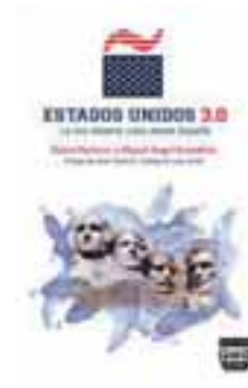
ESTADOS UNIDOS 3.0 Autores: Miguel Benedicto y Rafael Barberá Editorial: Plaza y Valdes, 2012 Páginas: 272 Precio: 16,50 euros