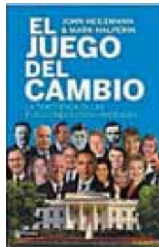
EL JUEGO DEL CAMBIO Autor: John Heilemann y Mark Halperin Editorial: Planeta, 2010 Páginas: 516 Precio: 5,95 euros.