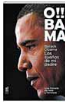
OBAMA. LOS SUEÑOS DE MI PADRE Autor: Barack Obama Editorial: Almed, 2004 Páginas: 405 Precio: 22 euros.