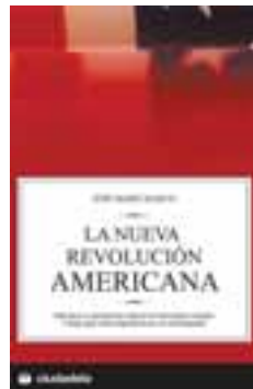
LA NUEVA REVOLUCIÓN AMERICANA Autor: José María Marco Editorial: Ciudadela Páginas: 416 Precio: 23 euros.